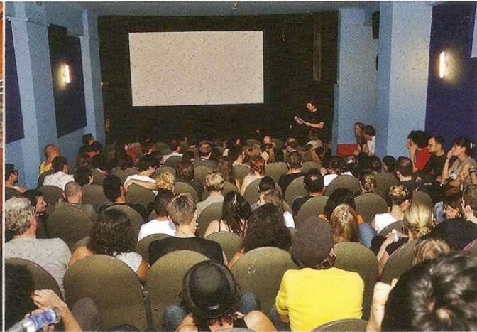
Ein Blick in den Schnittraum des KinoBerlino Kabarets 2012